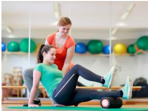
Therapie und Wellness

Ausbildung, Fort- und Weiterbildung, Studium