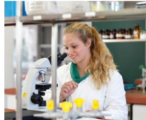
Medizin und Labor